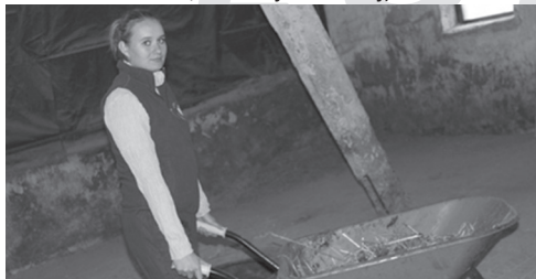
G7.B Praktyki dla studentów w terenach Czech, Słowacji i Polskiej