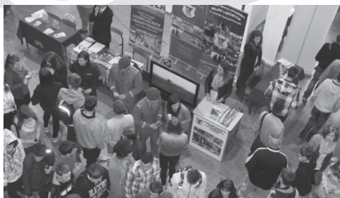
G3.I EJD Transgraniczne targi pracy w Prudniku