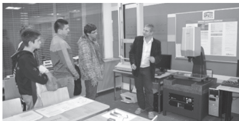
G7.B Wymiany studentów (praktyki dla studentów w terenach Czech, Słowacji i Polskiej)