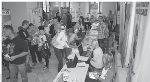
G3.G Transgraniczne targi pracy w Głubczycach