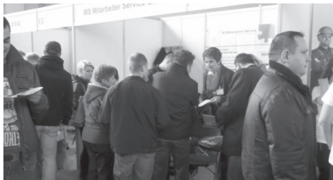
G3.F Transgraniczne targi pracy Perspektywy Nysa