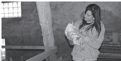
G7.B Praktyki dla studentów w terenach Czech, Słowacji i Polskiej