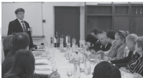
G3.D Targi pracy w Čadcy, Konferencja towarzysząca