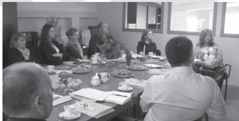
G2.B Spotkanie s polskimi pracodawcami w Żywcu