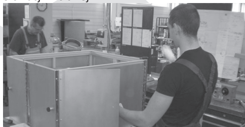
G7.B Praktyki dla studentów w terenach Czech, Słowacji i Polskiej