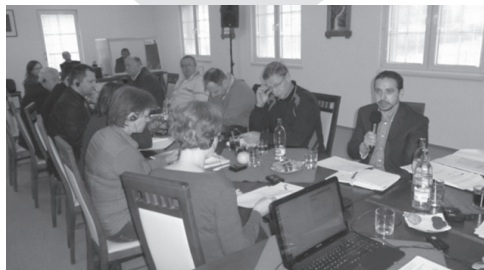
Spotkanie Wyboru Sterującego w Zubercu (SK)