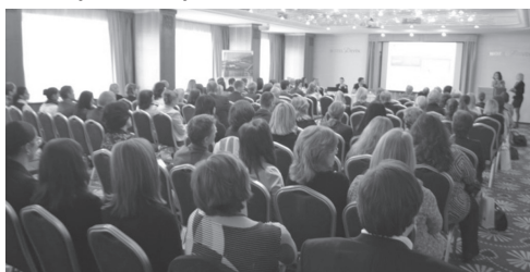
G7.D Konferencja z okazji 10 rocznicy powstania sieci EURES na Słowacji