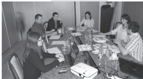
Spotkanie Grupy Informacyjnej w Namestovie

Informacyjna Grupa Robocza spotkała się (13.11.2014 i 18.12.2014), aby zakończyć zadania określone w planie działań. Jeden raz grupa ta spotkała się z innymi osobami kontaktowymi partnerów w celu wymiany informacji w jaki sposób mają być przeprowadzane poszczególne działania (29.10.2013). Księgowość była prowadzona wg dyrektyw finansowych i słowackich zasad rachunkowości instytucji finansowanych ze środków publicznych.