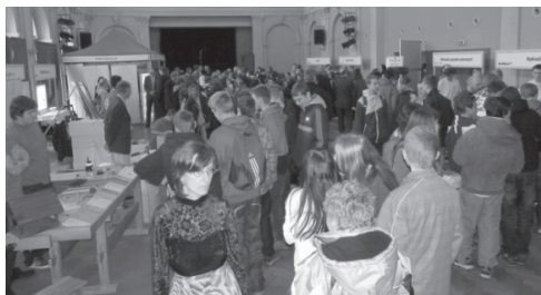
G3.C Targi pracy Artifex 2013

Uczniowie zostali zaproszeni do rozwiązywania quizów przygotowanych przez organizatorów, obecni pracodawcy przedstawili różne działania, które organizują dla uczniów, różne programy praktyk uczniowskich i formy wsparcia miejscowych okolicznych szkół. Spotkanie w Żylinie nie odbyło się.