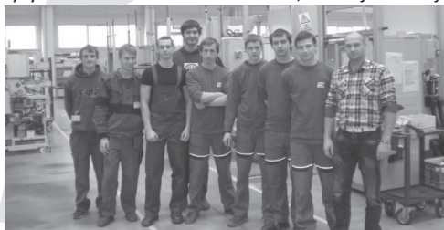
G7.B Praktyki dla studentów w terenach Czech, Słowacji i Polskiej