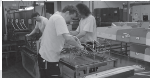
G7.B Praktyki dla studentów w terenach Czech, Słowacji i Polskiej