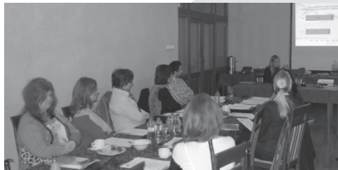
G2.A Spotkanie s pracodawcami w Namestowie