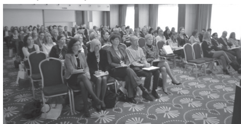
G7.D Konferencja z okazji 10 rocznicy powstania sieci EURES na Słowacji