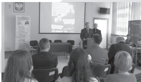
G3.K Młodzieżowe dni pracy OHP, otwarcie w Bielsku Białym