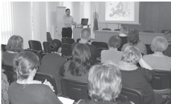
G1.A Szkolenie dla pracowników Urzędu pracy w Namestovie

11. 12. 2014 KOP UPCR Frýdek-Místek (11 pracowników z działu służby zatrudnienia)