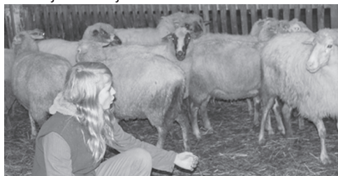
G7.B Praktyki dla studentów w terenach Czech, Słowacji i Polskiej